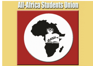
All-African Student Union Union Panafricaine des Etudiants www.aasu.org.gh