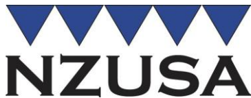
New Zealand Union of Students' Associations Te Roopu Ākonga o ngā Whare Wānanga o Aotearoa www.students.org.nz